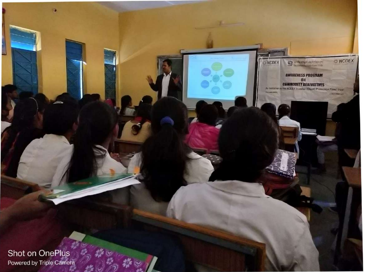
Shot on OnePlus Powered by Triple Camera